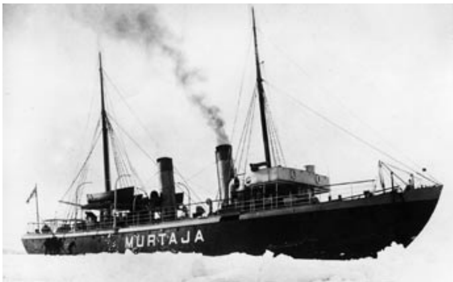
Ehkäpä erikoisin yhteysalus nähtiin saaristossa heti ensimmäisen maailmansodan jälkeen. Valtion höyrymurtaja Murtaja kuljetti Boren rahtauksessa matkustajia ja lastia.

laivat pysähtyivät ainakin Sottungan ja Föglön kunnissa matkatessaan Maarianhaminan kautta päätesatamiinsa Turkuun tai Tukholmaan. Turkulaisen Bore-yhtiön liikenteessä olivat Bore-laivojen lisäksi vuodesta 1907 alkaen höyrylaivat Boris ja vuodesta 1908 Skiftet .